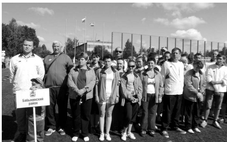
Команда Бабынинского района на XVIII областных летних сельских спортивных играх.

первенство по футболу. Итоги матчей I круга: 1 июня, «Звезда» – «Олимпик» – 4:1, 8 июня, «Спутник» – «Легенда» – 2:3, 15 июня, «Звезда» – «Спутник» – 3:2. Команда «Серпейск» Мещовского района сошла с дистанции. 29 июня в первенстве начался II круг: «Олимпик» – «Легенда» – 0:3, «Спутник» – «Звезда» – 2:1.